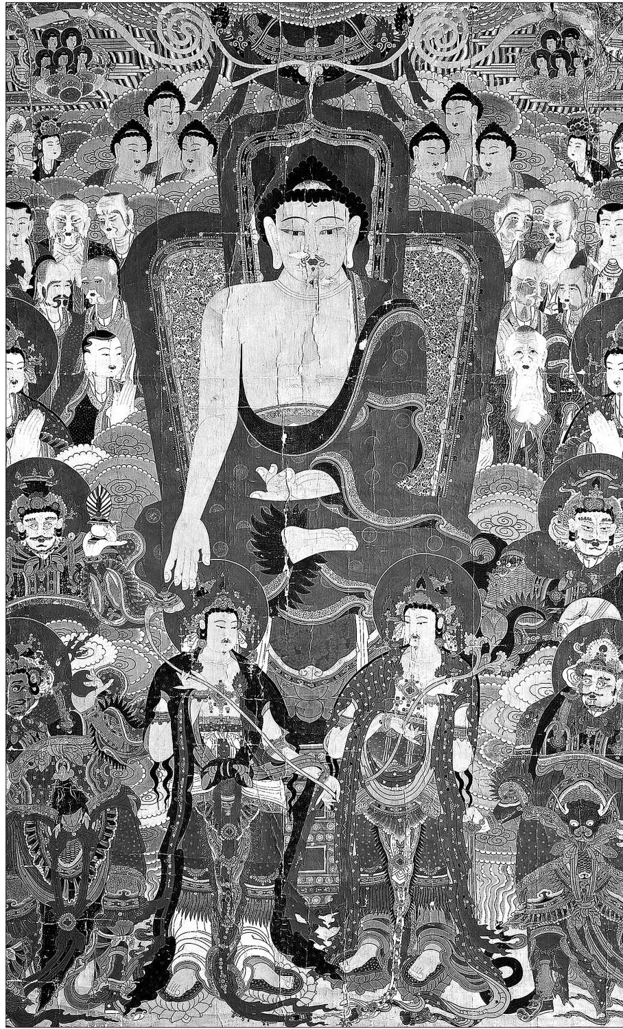
국보 제297호인 안심사영산회괘불탱(安心寺靈山會掛佛幀). 석가모니 부처님이 영취산에서 설법하는 장면을 묘사한 영산회상을 그린 괘불이다. 45년간 이어진 부처님의 설법은 처음과 끝이 다르지 않았다. 확고부동한 부처님의 가르침이 위대한 이유이다.

이 스승의 최후의 여행은 라자그리하(왕사성)에서 출발하여 북쪽으로 향하여 (벳다리촌) 지금의 파트나에서 강가—(간디스강)를 북쪽에서 건너며 벳살리(비사리)를 지나서 쿠쉬나가라의 맛라(말나) 족(族)의 소속 영토인 사라(紗羅)의 숲에 다다랐으며 거기에서 큰 임종(臨終)을 맞이함으로써 막