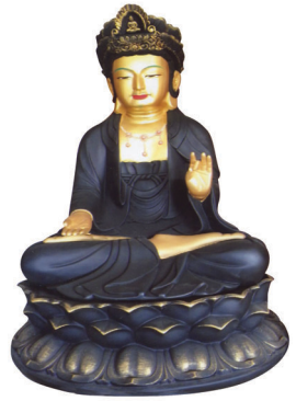
대나무 숲 부처님 (동불, 특수불, 각종 불상)