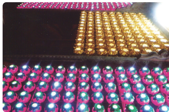
월출산 무위사 대법당