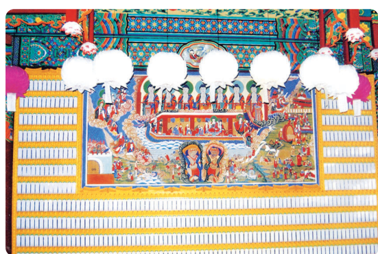
제주 월성사 위패단