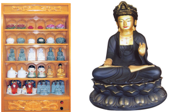
각종 인등 견본