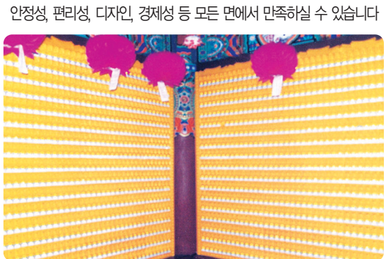
제주 월성사 인등