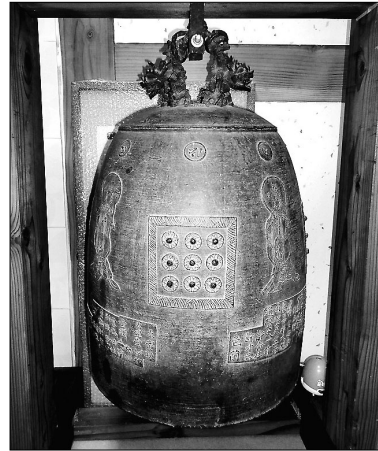
곡성 서산사 동종

조성과 관련된 연대, 장소, 장인이 기록돼 조선 후기 범종 연구의 귀중한 자료로서 가치가 있다. 곡성 연운당 고문서(健雲堂 古文書)는 과거 문서, 호적문서, 소지류, 일기류, 미암일기 등초록 등 일괄문서로 조선 후기 향촌사회와 제도사, 생활사 등을 이해하는 귀중한 기록유산이다. 해남 약수사 불교전적(藥修寺 佛教典籍)은 ‘대불정여래밀인수증류의보살만행수능엄경 권1~4(大佛頂如來密因修證了義諸菩薩萬行首楞嚴經 卷一~四)’ 등 7책의 불교 전적이다. 조선시대 임진왜란 이전에 간행된 귀중 희귀본 불서로 서지학적으로나 불교사상사 측면에서 귀중한 자료다.