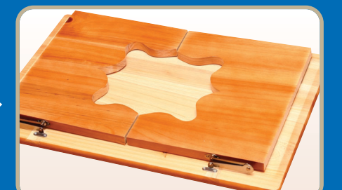
▶ 접은 상태