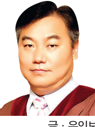
글·우인보 <불교문화예술학 박사>

이처럼 지금은 본래의 모습을 온전히 간직하지 못하고 있지만 13이라는 숫자에 담긴 불교적 세계관과 그 의미를 생각할 때, 정혜사지 13층탑이 갖는 종교적·문화적 가치의 중요성은 매우 큰 것이다. 더불어 정성스레 쌓은 13층탑의 모습에서 당시 신라인들이 탑 안에 담아낸 불심(佛心) 또한 얼마나 깊고 큰 것이었는지 짐작해본다.