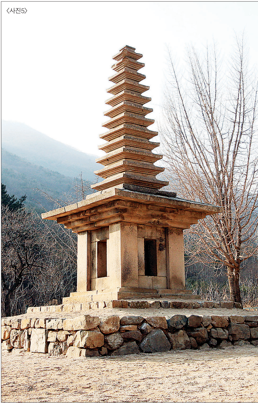
정혜사지 13층탑. 경주 안강읍 옥산리에 위치해 있다.