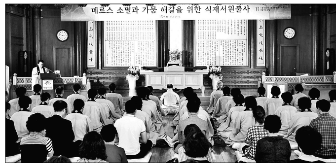
6월 14일 진각종 제69회 창교절 기념불사에는 진각종 종도들이 모여 창종의 의미를 되새겼다.

“진각종의 창교이념은 불교홍양, 밀교중흥, 현세정화, 심인현현이다. 진각종이 추구하는 근원적인 진리가 심인진리이기에 이 네가지의 이념은 결국 심인의 현현으로 모아진다.” 진각종(총리원장 회정 정사)은 6월 14일 서울 총인원 내 탑주심인당(서울시 성북구 화랑로13길)을 비롯한 진각성존 회당종조 탄생성지인 울릉도 금강원 내 총지심인당, 미국 LA 불광심인당 등 국내외 각 심인당에서 기념불사를 일제히 봉행하고 창종의 의미를 되새겼다. 진각종 총리원장 회정 정사는 주석처인 탑주심인당에서 봉행된 창교절 기념불사에서 “진각성존 회당 대종사께서 창교라고 하신 뜻은 전통적인 한 교법을 중심으로 종파를 일으킨 것이 아니라 다