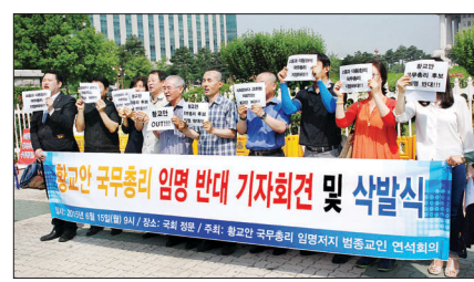
황교안 국무총리 임명저지 범종교인 연석회의는 6월 15일 국회 정문 앞에서 식발 시위를 열고 황 총리 후보자 임명 철회를 촉구했다.

이어 “종교인들은 이번 국무총리의 임명과정에서 공무원의 종교적 중립의무를 국민들의 항시적인 철저한 감시에 의해서만이 지켜질 수 있다는 결론에 도달했다”면서 “따라서 우리는 (가칭)공직자 종교편향 감시 범종교인 대책회의를 결성하고, 향후 황교안 국무총리를 포함하여 공직자의 편향적 종교적 가치관이 공직 수