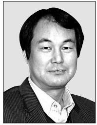
원영상 학회장 한일불교문화학회

몇 년 전의 일이다. 일본에서 학술 교류가 있어 출장을 갈 기회가 있었다. 당시 일본에서는 지금 한국과 같이 메르스 같은 전염병이 돌고 있을 때였다.