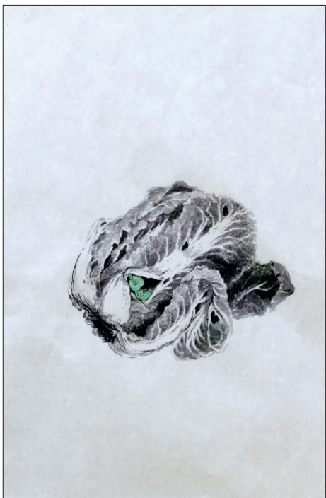
배추를 본다. 김장이 끝나고 남겨진 배추는 추운 겨울을 나면서 마르고 썩어 볼품없이 버린 물건이 되었다. 그러나 그 썩은 배추 속에도 생명의 가치는 빛을 발하고 있다. 살아있는 가르침이다. '배추, 70X70cm, 종이에 수묵 채색, 2015, 작가소장'

스님의 눈은 선과 형태 그리고 명암이 뚜렷하다. '눈부처'와 같다. 눈빛은 맑고 파랗고 깊다.