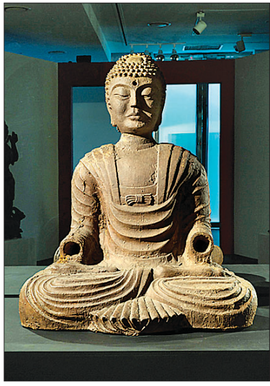
포스코갤러리는 개관 20주년을 맞아 '철이 철철' 전을 개최한다. 고려 철제여래좌상(좌)과 고려시대의 철조탑

불자 작가 백남준(1932~2006)의 '붓다킹'은 서양의 왕과 동양의 부처님이 교차하고 살롱 무어맨의 영상이 상영되는 작품