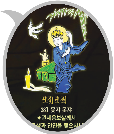
신묘장구 대다라니 족자 중의 '못자못자' 확대사진

법보시용으로 탁월하며 각 가정에 행운과 복을 선사합니다. 10개 이상 구매시 원하시는 문구를 새겨 드립니다.