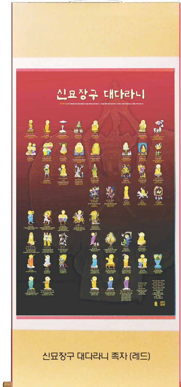
신묘장구 대다라니 족자 (레드)