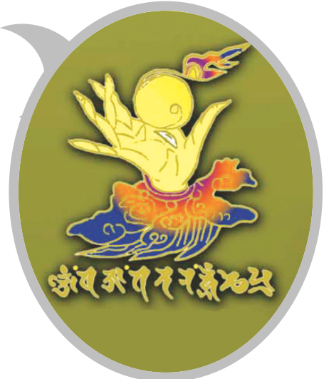
42수진언 족자 중의 '여의수주 진언' 확대사진