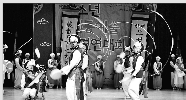
청소년전통예술경연대회에는 15개팀이 참여했다.

대회 1부는 경하 현성 스님의 대회사로 시작한 한국청소년단체협의회 회장의 축사와 청소년교화연합회 창립49주년 기념 유공지도자와 모범청소년 표창 등으로 진행됐다. 2부에서