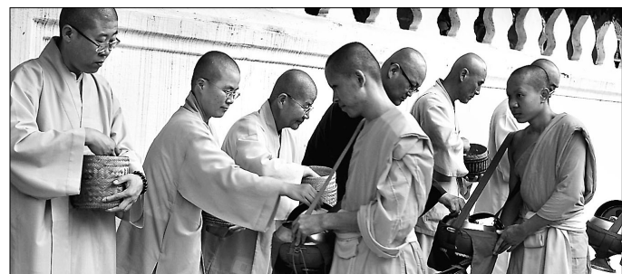
종단협 대표단 스님들은 라오스 거리타악에 동참했다.