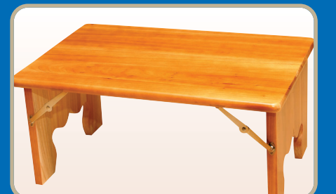
▶ 편백나무 경상