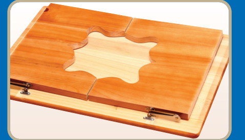
▶ 접은 상태