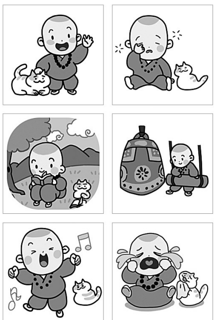
'반야'는 사랑스러운 24종의 동자승 캐릭터와 절냥이를 담은 있다. 총24종으로 10~30대의 취향을 반영해 귀엽고 유머스럽게 꾸며졌다.

포교원은 "반야의 귀엽고 친근한 이모티콘은 어린이, 청소년은 물론, 모든 사람에게 사랑받을 것으로 기대한다. 이를 통해 대중에게 한 걸음 다가가는 불교가 될 것"이라고 밝혔다.