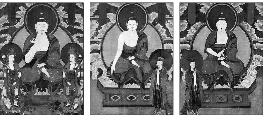
범어사와 국외소재문화재단의 협력으로 경매에서 낙찰받아 환수한 조선 칠성도 불화. 왼쪽부터 '치성령여래 일광보살 월광보살도', '제5광팔지변여래 염정성군도', '제6광해유희여래 무곡성군도'.

1950~60년대 혼란기에 유출 국외재단 모니터링 중 발견 "19세기 대표 불화" 평가 원소재처 범어사 경매 낙찰 불교계·국가기관 협력사례