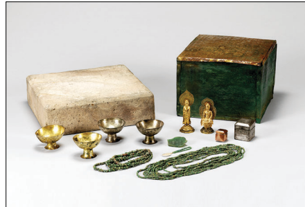
신라 신목태후가 시주한 황복사지 사리구

는 성보가 7건 77점에 달한다. 수덕사가 소장하고 있는 '문수사 아미타불 복장물'(보물 1572호)의 복식과 아름다운 직물은 고려 시대 수준 높은 직물 문화를 보여주며, 파계사 원통전의 관음보살상 복장물인 '영조대왕 도포와 발원문'(중요민속문화재