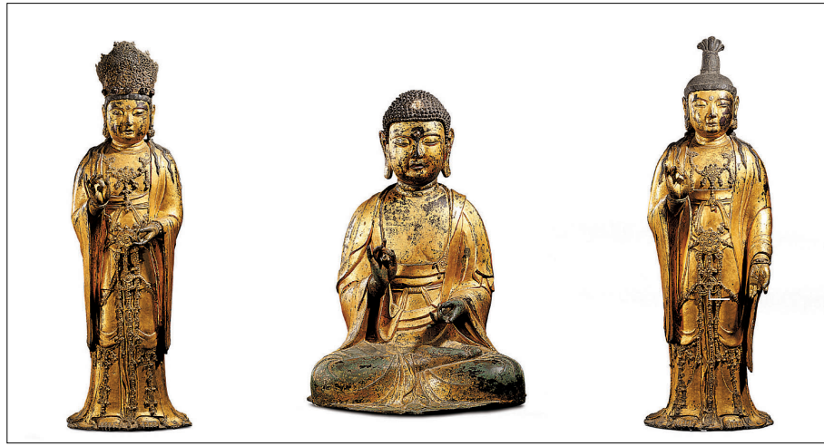
'길택' '만덕' '금이' 등 평민들의 시주자 이름이 대거 등장한 고려 아미타삼존불

국립중앙박물관 소장품 이외에도 사찰이 소장하고 있는 다양한 문화재의 복장물도 일반에 공개된다. 사찰에서 소장하고 있