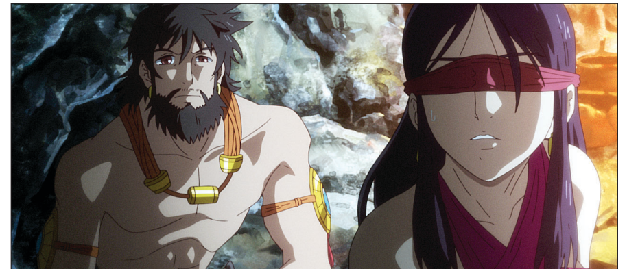
'붓다, 위대한 여정'은 싯다르타의 깨달음의 여정을 담고 있다.