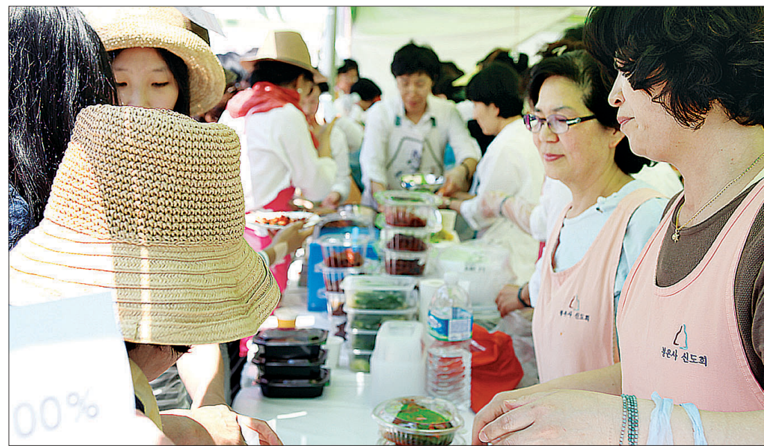
자비나눔 장터에서 친환경 직거래 물품을 구입하는 불자들의 모습