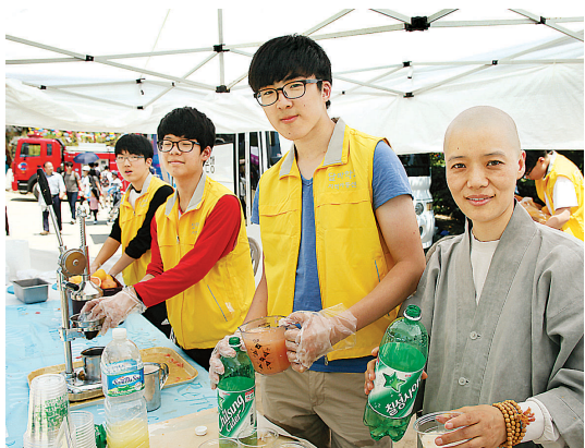
달마학교 자용주스 부스의 지도법사 스님과 학생들