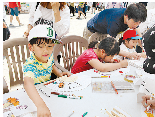
전통문화마당에서 부채 만들기예 열중하는 아이들.