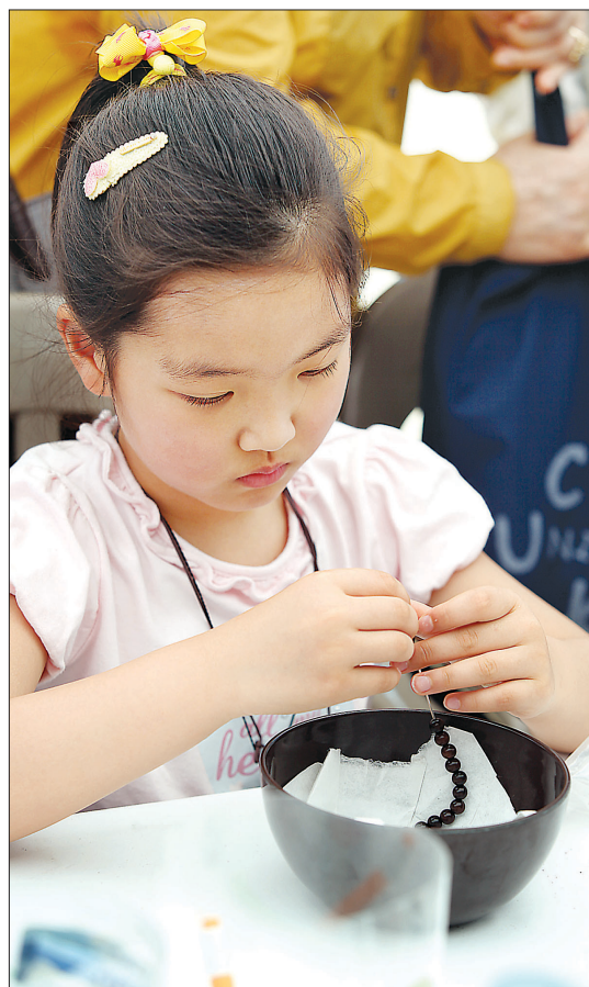
염주를 조용히 꿰고 있는 아이. 이날 전통문화마당에는 가족단위 참석자가 많았다.