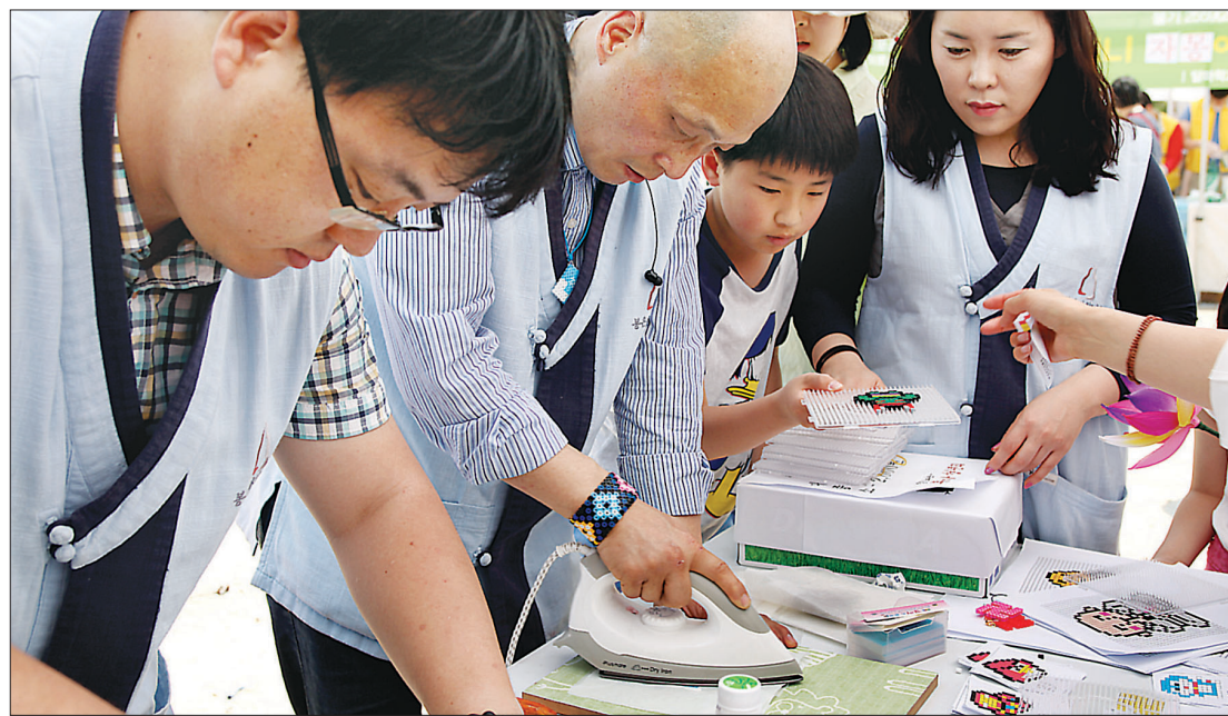
봉은사 자원봉사자들이 전통문화마당에서 아이들이 만든 캐릭터 상품을 다리미로 전시하는 모습