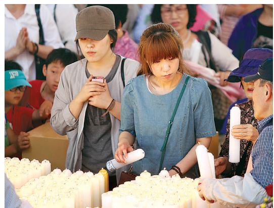
오후에 진행된 헌등행사에서 촛불을 밝히고 있다.

모든 수익금도 신도회의 행복나눔기금으로 적립돼 봉은사가 수탁운영하는 다양한 복지기관과 불우이웃돕기 등에 사용됐다. 복지법인 봉은이 설립·운영 중인 달마학교 등 기관 외에도 광진희망세상, 도계비방망이, 진관, 꾸러기공방방, 도토리 학교, 포이동인연맺기 등 지역아동센터와 여성청소년수련관, 대치노인종합복지관 등 복지관까지 봉은사가 지원하는 곳은 다양하다. 지역아동센터는 성금으로 학용품 구입하거나 학생들의 새 학기 준비에 사용하는 등 재원을 활용하고 있다.