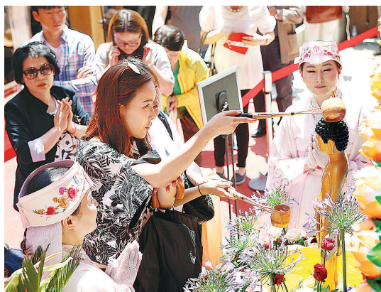
전통문화마당에서 관육에 동참하는 불자들