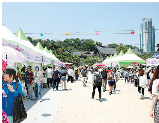
봉은사 앞마당은 오후 늦게까지 행사 인파로 북적였다.