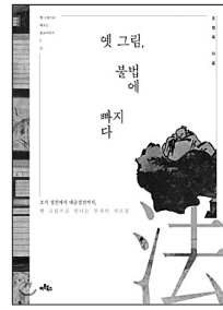
옛 그림, 불법에 빠지다 조정욱 지음 아트북스 펴냄 2만 2천원

불자들은 왜 경전을 강독하고 사경을 할까? 불교 경전이 우리에게 전하는 메시지는 무엇일까? '힐링멘토' 등이 나타나는 현상에는 왜 사람들이 항상 넘칠까? 오랜 세월 인류의 갈등을 달래준 경전은 '뿌리 깊은 나무' 이자 '생이 깊은 물'이다. 저자는 초기 경전서 대승경전까지, 그리고 중국 경전까지 정독하며 삶의 지혜를 찾고 마음을 닦는다. 여기에 우리의 옛 그림이 동행해 세월의 맛을 더해준다.