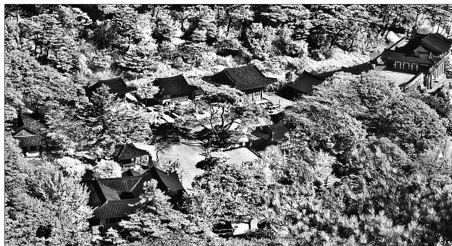
한국불교사진협회는 5월 26일까지 회원전을 갖는다. 작품은 김동암의 '전등사'.

제 20회 한국불교사진협회 회원전이 5월 20일~26일 불일미술관에서 열린다. '사찰전경'을 주제로 한 이번 전시는 회원 63명의 작품이 전시된다.