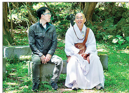
SBS 힐링캠프는 방송인 김제동 씨가 존경하는 스승 법륜 스님을 초대한다.