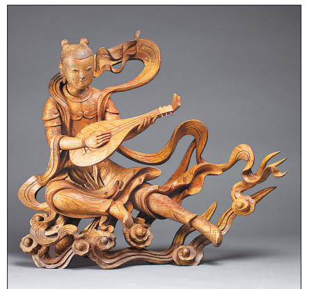
소나무 조각으로 완성한 허길량의 비천상.

입문 서수연 이인호 선생으로부터 불화와 단청 작업을 사사받았다. 1980년 우일 스님 문하생으로 입문 도상 의식기법을 전수받았으며 2001년 중요무형문화재 제 108호 목조각장으로 지정받기도 했다. 2002년 '33 관음 속으로' 개인전을 개최했으며 2014년 예술의 전당에서 '소나무 비천이 되어'展을 개최했다. 정혜숙 기자