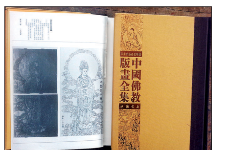
cm인 대형이다. 전집은 한화 2천만원에 육박하는 고판화 사상 중국 역대 최대 규모의 출판으로 꼽힌다.

고판화박물관(관장 한선학)은 5월 13일 베이징 고궁박물관 도서관장이며 중국 판화의 권위자인 원리엔시(翁連溪)가 주관한 <중국불교판화전집>에 원주 명주사 고판화박물관이 소장한 중국판화 100여점이 수록됐다.