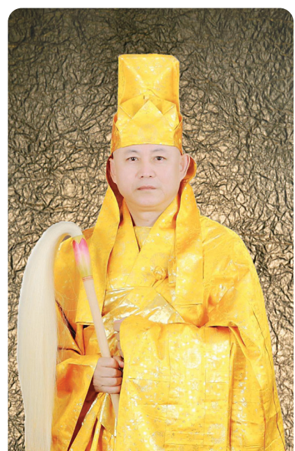
석가여래정법안장 제 77세 정산 석청봉 대종사