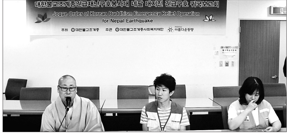
조계종 긴급재난구호봉사단이 5월 11일 기자회견을 열고 향후 계획을 밝혔다.

추가 여진이 발생한 상황이지만 한국불교계 국제구호 단체는 활동을 이어가고 있다. 지진참사 이후 가장 먼저 구호활동을 전