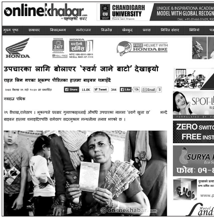
네팔 언론 온라인하바르가 한국 NGO를 비판한 기사

네팔 언론 비판 기사 게재 SNS도 “네팔인 모욕” 성토 단체 사과했지만 '망신' 초래