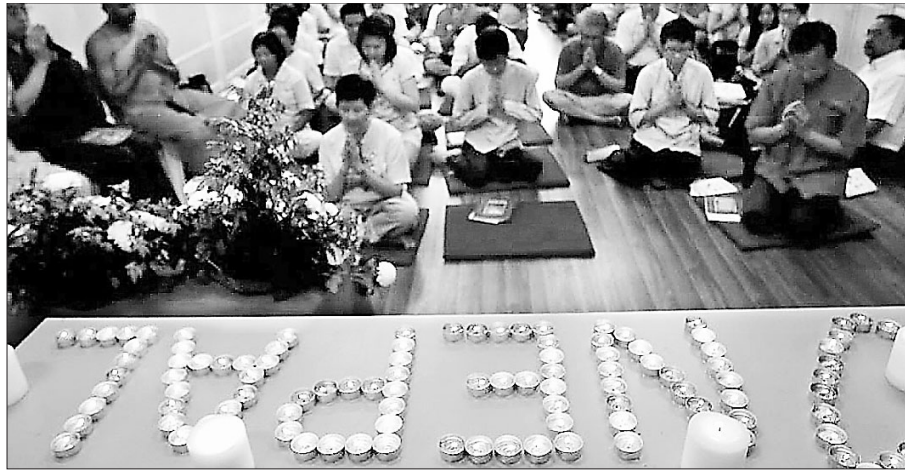
지난 5월 3일 네팔, 말레이시아를 비롯한 동남아 지역에서 열린 석가탄신일 행사는 네팔지진피해 희생자 추모재로 진행됐다. 사진은 말레이시아 쿠알라룸푸르에 위치한 스리랑카 사찰에서 추모 기도를 올리는 모습이다.

일부 사찰 문 닫고 신도 발길 끊겨... 조용한 석가탄신일 말레이시아, 인도 등 부처님오신날 행사서 추모재도 함께