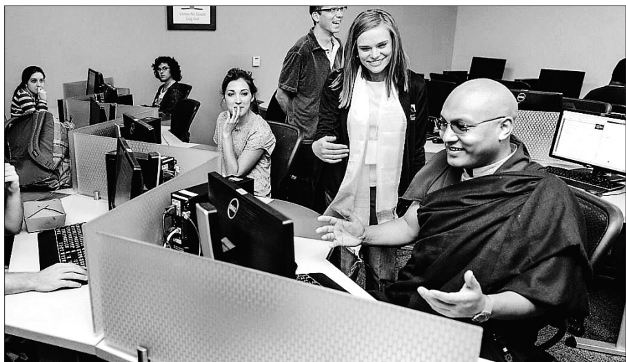
프린스턴대학에서 '젠더와 성' 주제 수업을 들은 17대 카르마파(Karmapa) 오겐 트린래 도제(Ogyen Trinley Dorje)이 함께 수업을 들은 대학생들과 기념 촬영을 했다.

이에 앞서 "17대 카르마파는 프린스턴대학 명상 동아리 회원들과 함께 '명상 법