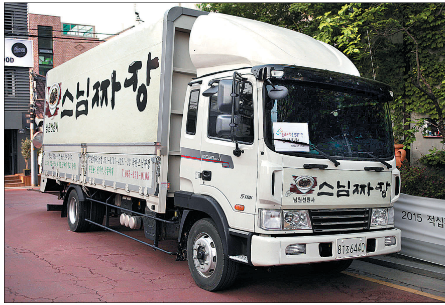
윤천 스님의 스님짜장 5t 트럭. 스님은 여기에 대형 숟 등을 싣고 전국을 누빈다.