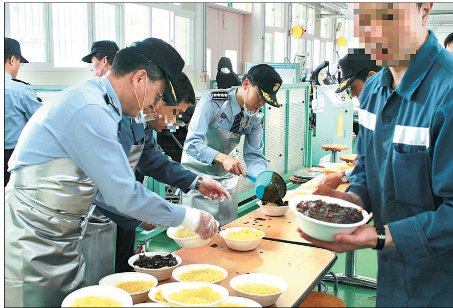
스님짜장을 배식받는 교도소 재소자들