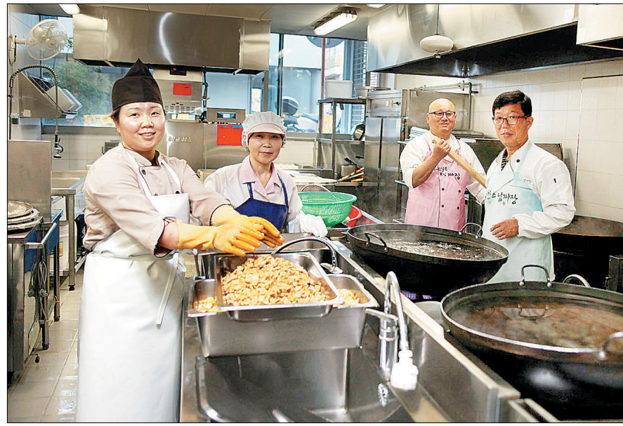
최근에는 현지의 자원봉사자들과 협동하여 짜장면을 만든다.