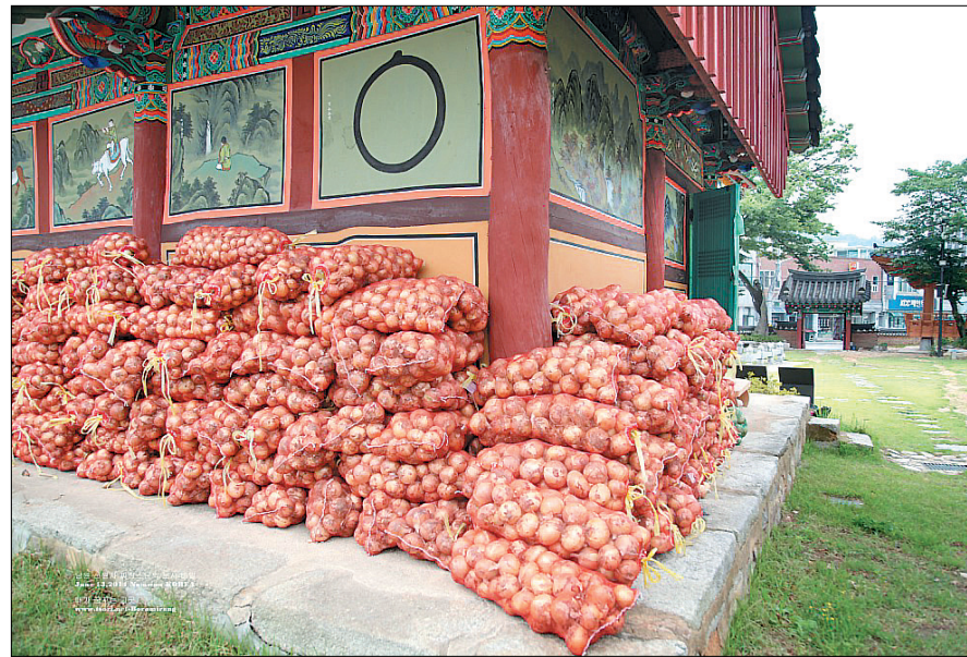
남원 선원사 철불과 함께 보물로 일컬어지는 양파 등 짜장면 재료들