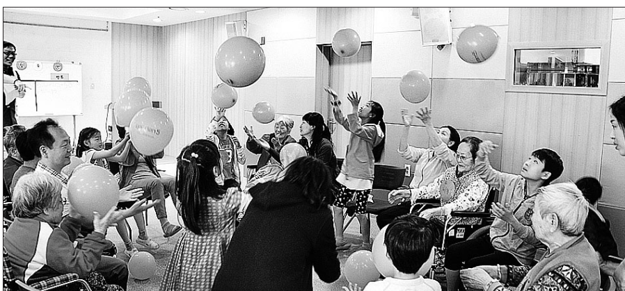
'할머니네 가는 날' 행사에 참여한 가족들이 어르신들과 게임하며 즐거운 시간을 보내고 있다.

송파노인요양센터는 "3세대가 어우러져 가족들이 함께하는 시간을 통해 서로를 이해하고 보듬어 주고자 마련된 행사다. 어린이들은 어르신과 함께 지내며 노인의 삶을 이해할 수 있는 기회가 되고, 어르신들은 사회의 어른으로서 따뜻한 기질을 가족을 바라보며 긍정적인 마음을 가질 수 있는 기회가 되었다"고 설명했다.