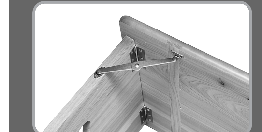
▶접이식 고급 경첩