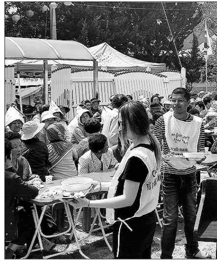
외국인 노동자들이 배식봉사를 하고 있다.

이번 100회 잔치는 어르신들 공양 대접은 물론 봉사자와 후원자들에게도 감사의 마음을 전하는 자리가 마련됐다. 야외 화장