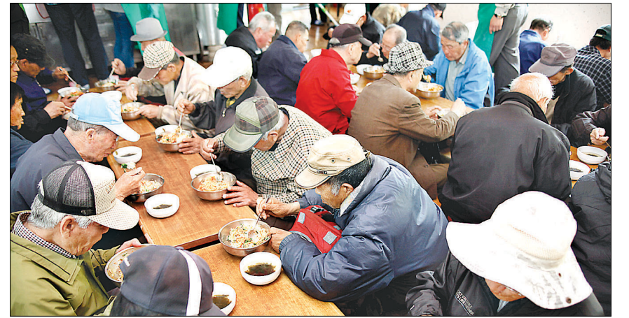
새로 개원한 무료급식소는 50여명을 수용하는 공간으로 바뀌었다. 이에 따라 찾는 어르신도 늘어나 자원봉사자의 참여가 필요하다.