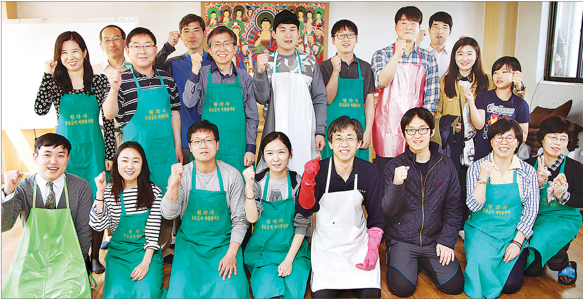
원각사 탐골공원 무료급식소에서 배식봉사에 참여한 서초반야회 회원들이 밝게 웃으며 파이팅을 외치고 있다. 이날 만큼은 법관과 변호사 등의 사회적 위치를 잊어버리고 한명의 봉사자로 즐겁게 배식봉사에 나섰다.