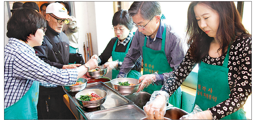
민일영 대법관(사진 왼쪽 2번째)과 이선미 변호사 등이 배식 행렬에 앞서 직접 나물반찬을 받위에 올리고 있다.