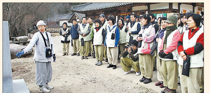
4월 1일 양산 통도사에서 진행된 서초반야회 성지순례 모습. 서초반야회는 매주 수요일 대성사 법회와 함께 매년 2회씩 성지순례를 진행하고 있다.

1995년 서초동 법조단체에 근무하는 서울대 법대 출신 판사 13명이 주축이 돼 만든 서초반야회는 정기적인 성향을 배제하고 매주 수요일 우면산 대성사에서 정기법회와 봉사활동을 병행한다. 현재 판사, 검사, 변호사, 법원직원, 법무사 등 60여명이 회원으로 신행활동을 하고 있다. 매주 수요일에는 서울 우면산 대성사에서 정기법회를 보는 한편 매일 마지막주 토요일에는 원각사에서 노력봉사를 진행한다. 매일 둘째주 화요일에는 서초대법원 청사 내에서 경전공부를 하고 있다. 원각사 배식봉사는 박홍우 현 대전고법원장(당시 의정부지법원장)의 제안으로 이뤄졌다. 원각사 무료급식의 경우 회원들이 매년 20만원씩 모아서 낸다. 서울고등법원장 등을 역임한 김동건 법무법인 바른 명예대표를 비롯해 최병덕 법무법인 동인 대표(사법연수원장 역임), 이동홍 前 헌법재판관 등이 역대 회장을 지냈다.