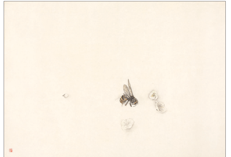
화삼매. 꽃은 그 향기가 지고 난 뒤 마르면서 고혹적이라 했다. 꽃은 그저 꽃일 뿐 떨어진 것이든 붙어 있는 것이든 그 의미와 가치가 있는 법이다.