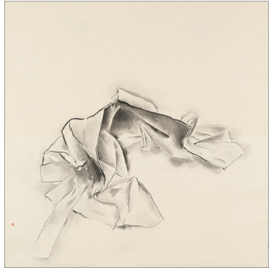
땃. 겹대기가 있다. 그것은 겹대기일 뿐 내용은 아니다. 불일암에서 스님을 아무리 불러 보았자 스님은 없다. 스님께서 남기신 자취만 있을 뿐이다. 막 수행을 마친 스님이 겹옷을 벗어 놓은 채 나가신 이유가 뭘까?

그림도, 물집도, 대상도 세상사이며 세월의 흐름이다. 나는 법정스님을 그리며 찾은 불일암에서 여백을 보았다. 자연은 남겨 놓음으로써 담담하게 본질을 이야기한다. 공영함, 정서나 함의를 여백에 기탁해 법정스님께서 말씀하신 생명성을 드러내고 싶었다. 여백이 본질이다.