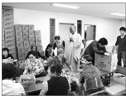
날-부처님 품안 따뜻한 병영생활-군종교구'가 새겨져 있다.

예산이 넉넉지 않은 군종교구는 오는 5월말까지 자비의 선물 기금을 마련하기 위한 캠페인을 펼치게 된다. 군포교 지원단체 회원 40여 명은 4월 30일 자비의 선물 포장 작업을 전개했다. 자비의 선물 곁면에는 '부족 부처님오신