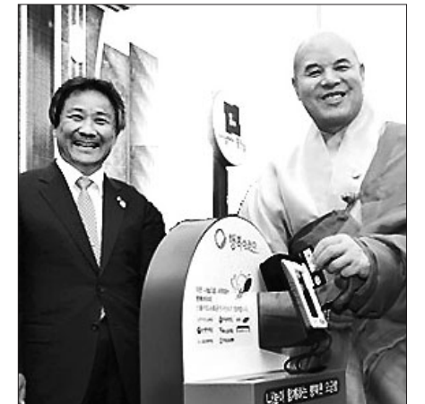
행복바라미 카드결제에 동참한 자승스님

각 지역에서 모인 기부금을 따로 합산하지 않는다. 그 지역 사찰 신도회가 자체적으로 대상자를 선정하고 지원한다. 재정의 투명성을 위해 카드 단말기를 활용한 기부 시스템을 구축한 것도 특징이다. 이 모금 캠페인을 통해 2013년 209명, 지난해 260명의 이움을 도왔다. 올해는 500명 지원을 목표로 하고 있다.