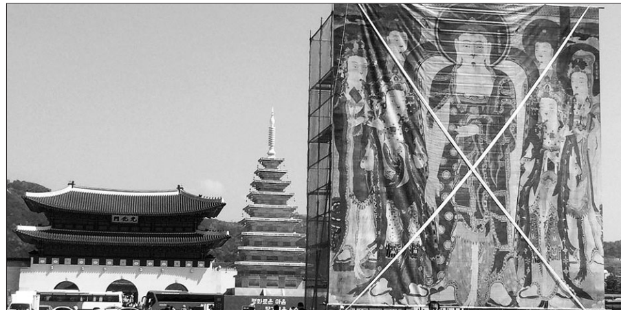
4월 30일 행복바라미 축전을 위해 광화문에 걸린 미항사 패블

전통문화축제는 이날 서울을 시작으로 부산 등 전국 주요 도시 10곳에서 연다. 2