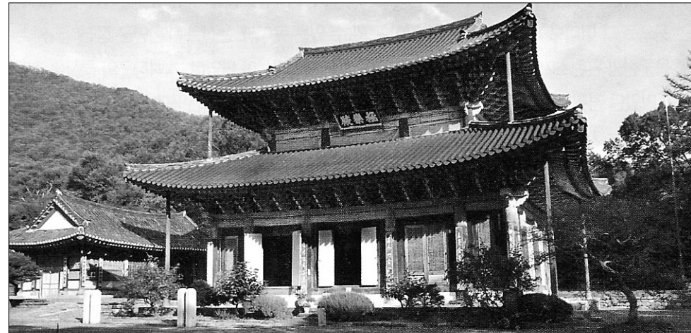
무량사의 극락전은 특이하게 2층 구조를 하고 있어 다른 사찰에서 보기 드문 건축물이다. 보물 356호로 조선중기 때 지어졌다.