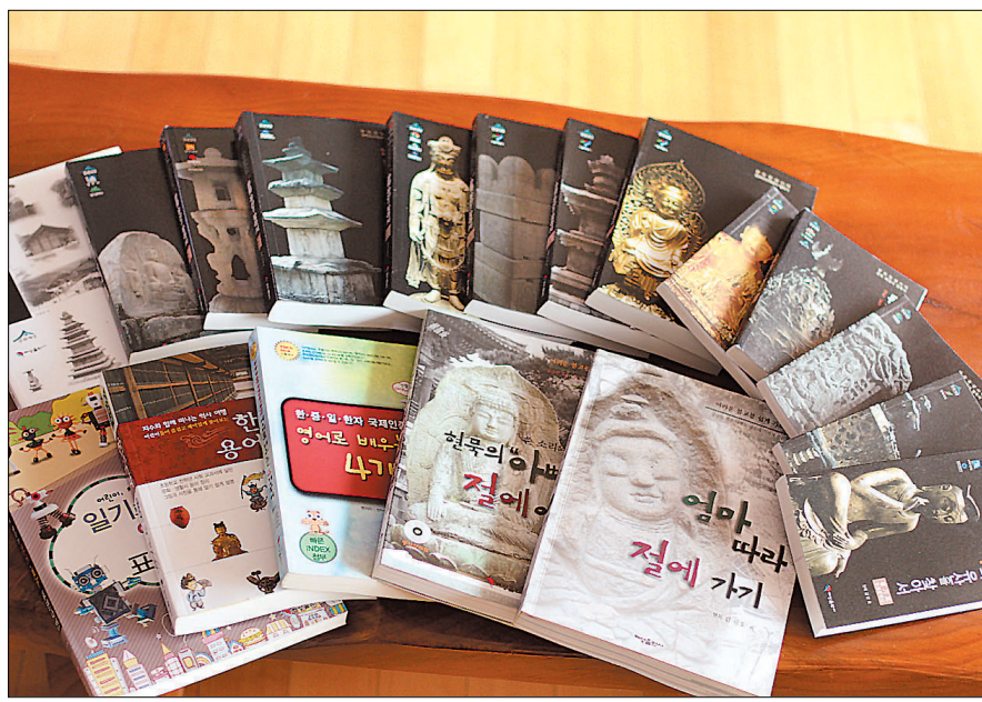
<엄마 따라 절에 가기>, <국보·보물 문화유산을 찾아서> 등 어린이들을 위한 문화 해설서 및 불교 관련 지식의 백과사전 등 20여권을 책으로 펼쳐냈다.