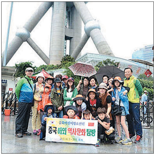
태영장학회 설립 매년 개근 학생들에게 해외탐방을 보내고 있다.