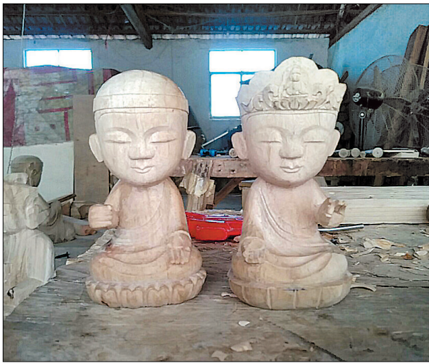
홍승으로 제작한 불상. 학생들에게 친근한 모습이 되도록 제작되었다.

결과다. 그의 나이 예순이 넘어 동국대 경주캠퍼스 불교 아동심리치료학과에 입학했다. 매일 밤새워 공부해 수석으로 졸업했고 상담심리 1급·미술 심리 1급 자격증에 복지사 자격증도 따다. 이후 석사과정을 마치고 현재 동국대 객원교수로 활동중이다.