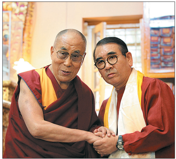
지난해 인도 다람살라에서 달라이라마 친견.