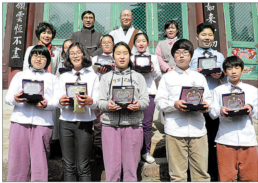
부산 금화사에서 19년동안 어린이 포교를 담당한 그는 200여명의 제자를 배출해 내었다.