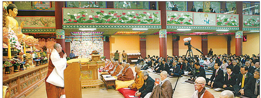
1회 섬섬제가 4월 19일 대구 망월지 불광사 경북불교대학에서 열렸다.

이와 함께 두꺼비를 소재로 한 시낭송, 시 노래 등의 퍼포먼스가 진행됐으며 전국 유명 시인 100여명이 참여한 섬섬제 시화전도 눈길을 끌었다. 손문철 대구지사장