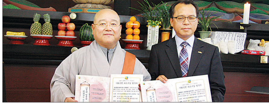
동명불원은 용호종합사회복지관과 협약을 맺고 지역사회복지를 위해 함께 힘을 쓸 것을 약속했다.