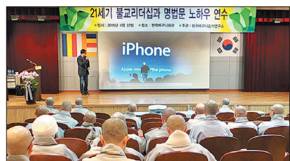
한국비구니승가연구소는 4월 22일 전국비구니회관 법통사에서 비구니 스님들을 대상으로 '21세기 불교리더십과 명법문 노하우' 연수를 개최했다.