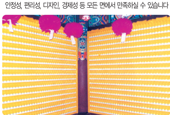
제주 월성사 인등