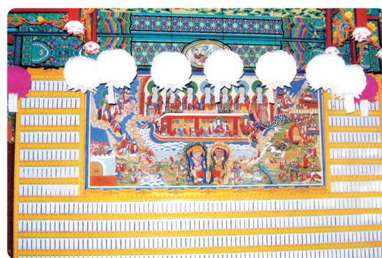
제주 월성사 위패단