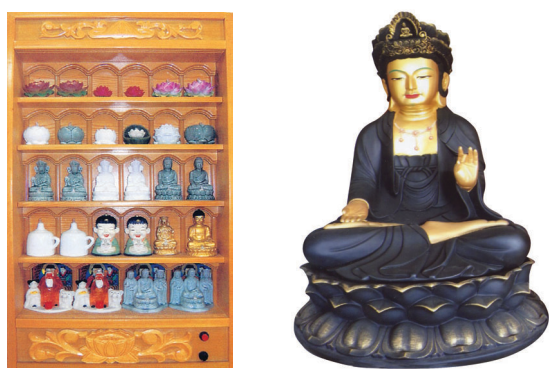
각종 인등 견본