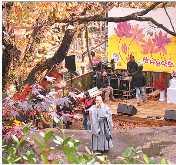
심곡암에서 열린 산사음악회 모습