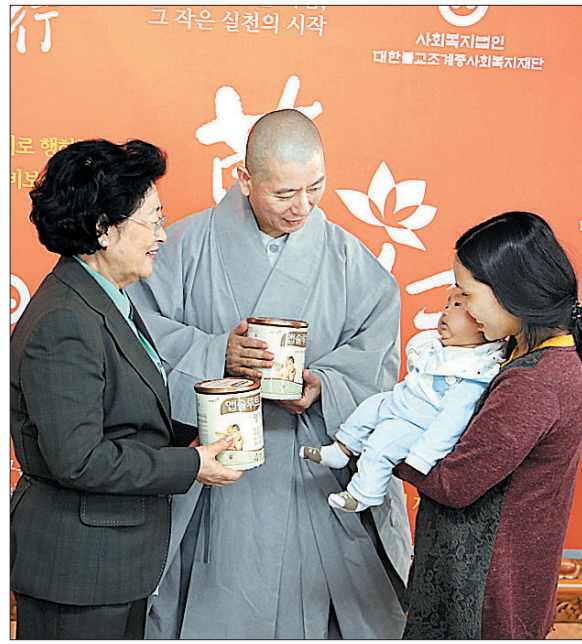
사회복지재단 상임이사 시절 저소득 아동 돌기 모습