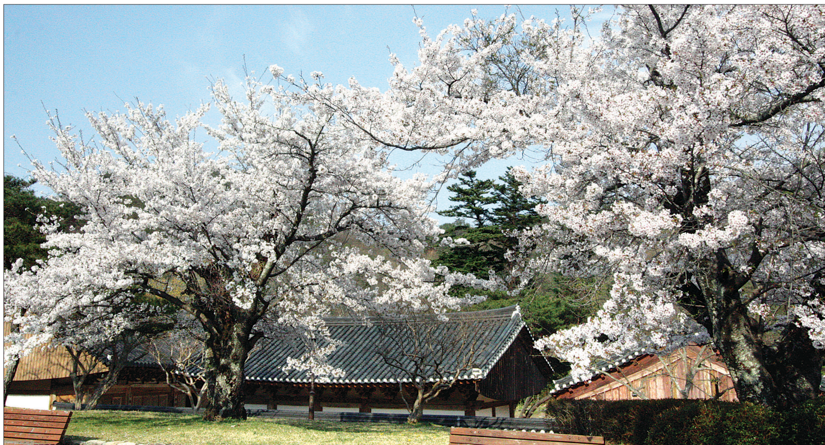
깨달음을 얻은 석가모니 부처님이 하안거를 보내신 기원정사의 숲인 '기림'에서 불여진 경주 함월산 자락에 위치한 기림사. 흐드러지게 핀 벚꽃이 전각을 하얗게 뒤덮고 있다.

경주 함월산 기슭에 있는 기림사(祇林寺)는 불국사보다 앞서 지어진 가람이다. 한때는 불국사를 말사로 거느릴 정도의 대찰이었다. 기림사는 천축국(인도)에서 온 광유성인이 창건해 임정사(林井寺)라고 불렀다. 그 후 신라 선덕여왕 12년(643)에 원효대사가 사찰을 크게 확장하면서 현재의 이름으로 바꾸었다. 이 때에 이미 대적광전을 건립해 삼신여래를 봉안했고, 동쪽에는 약사여래를 모신 약사전을 건립했다. 그리고 서쪽에는 석조여래상을 모신 응진전을, 동쪽에는 삼층목탑과 정광여래사리각을, 남쪽에는 무량수전과 진남루를 건립했다. 그러나 사리각은 없어지고 삼층목탑은 그터만 남아있다.