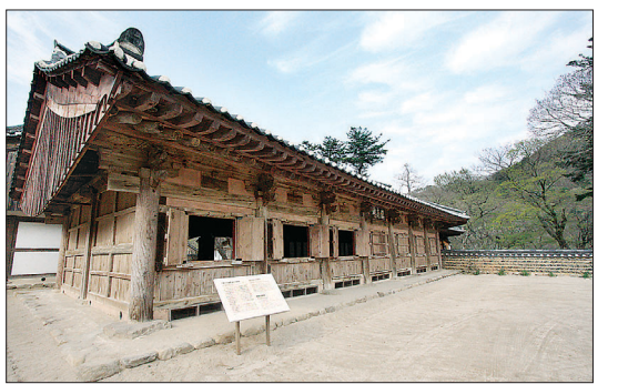
임진왜란때 승병지휘소였던 진남루