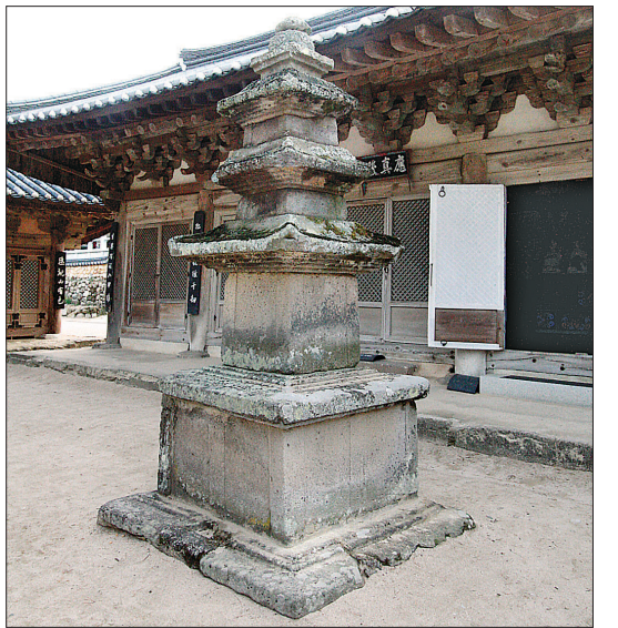
경상북도 유형문화재 제 205호인 삼층석탑