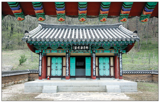
김시습 선생의 영정을 모신 매월당

계획"이라고 밝혔다. 천왕문을 지나면 반기는 것은 일자형으로 길게 좌우를 편 진남루다. 임진왜란 때 승병 지휘소로 사용되었던 진남루는 다른 절집의 강당처럼 거대하거나 높지 않다. 진남루 벽면은 외장 역할을 하는 나무문이 정갈한 모습으로 아무렇게 닫혀 있다. 장방형 문짝이 빛는 절묘한 조화가 조각보를 보는 듯한 아름다움을 선사하는 벽면이다. 진남루는 경남 고성 연화산 옥천사의 자방루와 비슷한 성격을 지닌 건물인 셈이다.