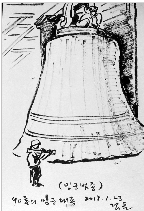
90톤에 달하는 청동대종 '민군범종'