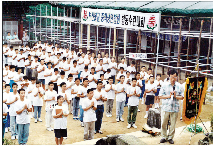
1990년 문경 김용사 부산불교중흥학생 연합회 합동수련회 개최 장면