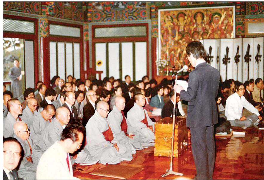
1983년 <부산불교안내> 발간 후 영유암에서 경과보고를 하는 현 법사

후배 양성의 원력을 세우고 다양한 활동을 하게 된다. 청소년 불자 양성을 위해 대불련 및 고등학생을 위한 불서보시, 대불련 간사단 선임 후배 육성 등에 정성을 기울였다. 또한 청소년 포교 활성화를 위한 부산불교학생회 간부수련대회를 개최하기도 했다.