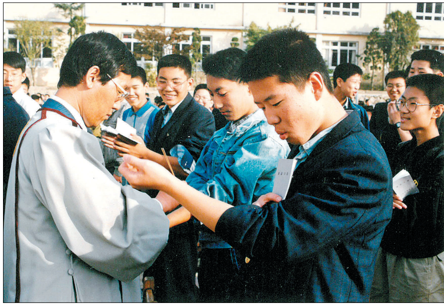
2006년 금정중 수계식, 금정중 교장 시절 학생 60% 이상을 수계를 받게 했다.