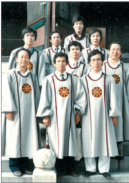
조계종 전법사 품수 기념 사진