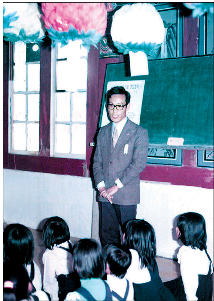
부산 최초 불교어린이회인 법륜의 창립법회