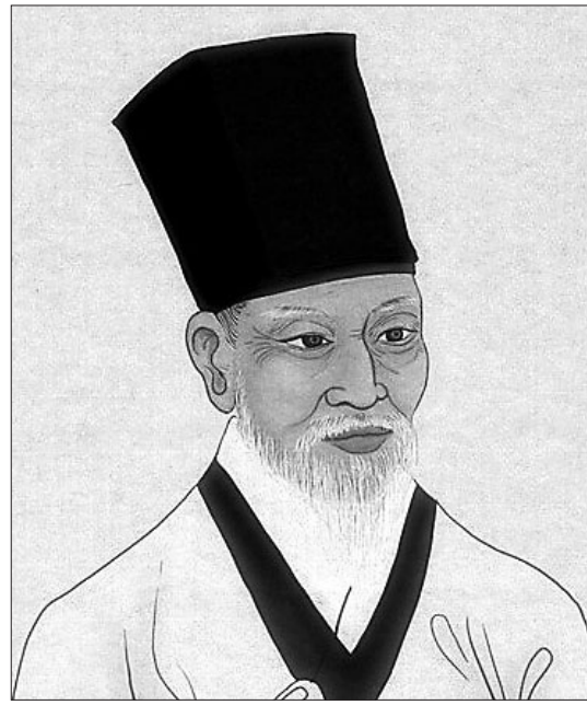
최한후기 실학자 최한기.

개인이 천인일치적인 삶인 천인운화에 도달하기 위해서는 내면에 품부된 활동운화의 본성을 발현시켜야 하는데, 그러자면 '깨달음'이라는 계기가 필요하다. 이 깨달음을 기학에서는 뜻밖에도 견성(見性)