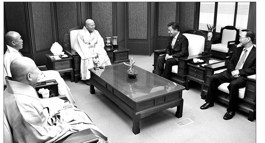
조계종 총무원장 자승 스님은 3월 31일 흥용표 통일부 장관의 예방을 받았다.