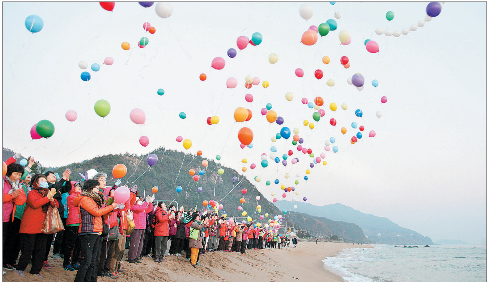
부처님 출가·열반 정신 오색풍선에

부대중은 이날 식별 대신 자신의 머리카락을 잘라 풍선에 붙인 후 하늘 위로 날리는 의식을 통해 부처님 깨달음의 의미를 되새겼다.