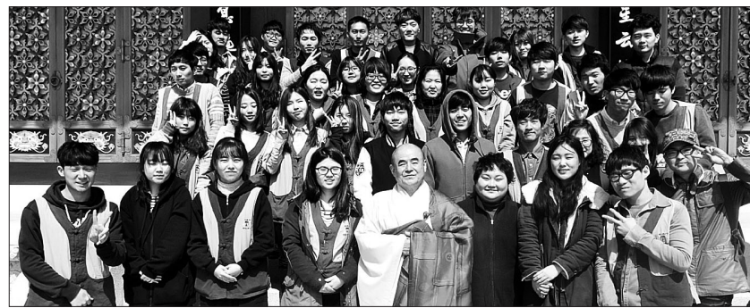
대불련은 3월 20~22일 석주 석주사에서 템플스테이를 개최했다.

한국대학생불교연합회(회장 이재춘, 이하 대불련)는 3월 20~22일 석주 석주사에서 템플스테이를 개최했다.