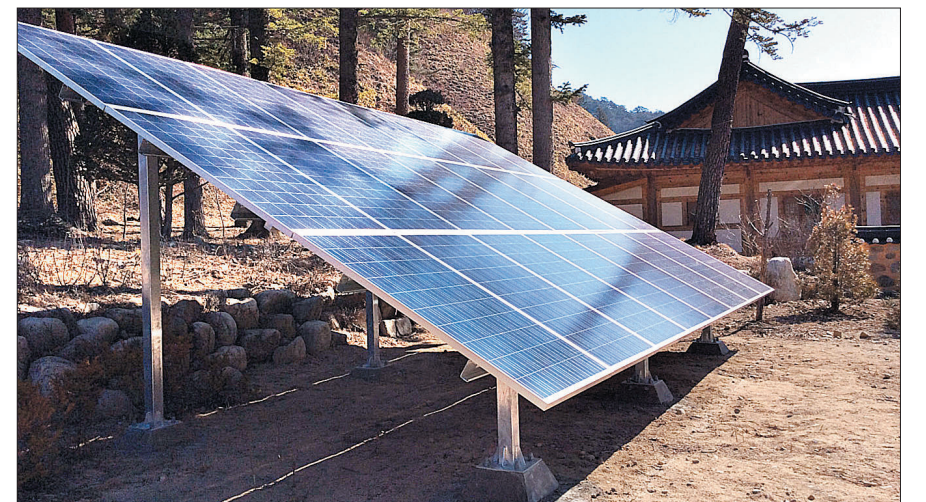
주한 영국대사관 기후변화과가 강원도 월정사에 설치한 태양광 발전 설비. 연중 7천227kWh의 전기를 태양광으로 대체하게 된다.