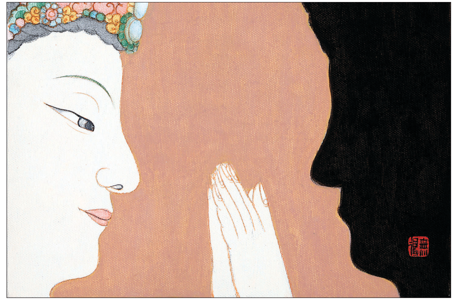
'자아'는 불두와 그림자가 마주보고 있는 모습으로 표현, 수행을 통해 스스로를 바라보는 과정을 그려냈다.

남편의 권유로 94년부터 불화를 그리기 시작한 김 작가는 7년째 조계사 청년부 학생들을 가르치고 있는 불화강사이기도 하