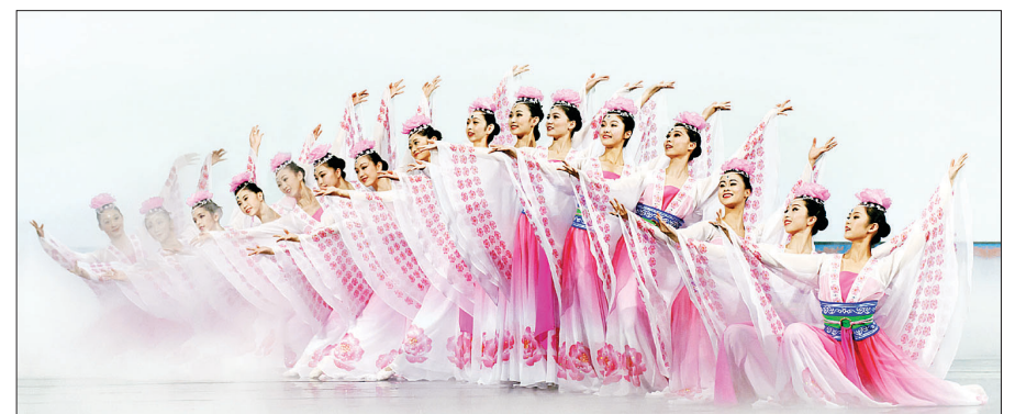
5천년 중국 문화를 무용으로 펼쳐내는 선원예술단이 4월 내한한다.

선원 공연의 프로그램은 문명이 싹트던 5천년 전 고대 철화에서, 역사에 등장했던 여러 왕조와 오늘날 현대 중국의 모습까지 다양하고 풍성한 이야기를 다룬다. 하늘과 땅과 사람이 조화를 이루는 중국의 전통적인 세계관을 표현하면서도 남녀노소 누구나 즐길 수 있는 흥미로운 스토리를 다채로운 무용으로 이끌어간다. 또 최첨단 기술로 탄생시킨 생동감 넘치는 무대배경과