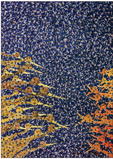
'바람의 기억' 시리즈 중 하나인 '행복향'

"그리고 또 그랬습니다. 일체 생명의 자유와 아름다움, 깨달음을 염원하며 30년 세월, 눈 깜짝할 사이였습니다. 어디든 갔습니다. 아시아, 아프리카, 유럽 등 생명이 있는 곳에 새를 날렸습니다. 수천수만 마리. 그리고 자유로운 새들이 날갯짓 속에서 즐기세포를 만들어 우주는 하나의 큰 생명의 덩어리임을 의했습니다. 살아 있는 모든 것은 존재 그 자체로 아마 충분히 아름답고 놀랍고도 신비로운 예술입니다." 세상은 일체 생명의 자유와 아름다움 그