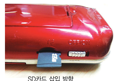
SD카드 삽입 방향

구입처: 현대불교현불샵 (02)2004-8214 입금계좌: 농협 053-01-269062 (주식회사)현대불교신문사