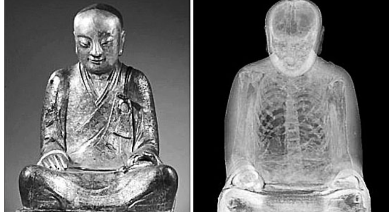
헝가리에서 미라를 주제로 한 전시회에 나온 미라 등신불이 중국에서 도난된 문화재라며 반환하라고 중국이 요구했다.