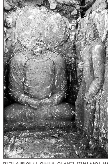
파키스탄에서 2천년 이상된 열반상이 발견됐다.