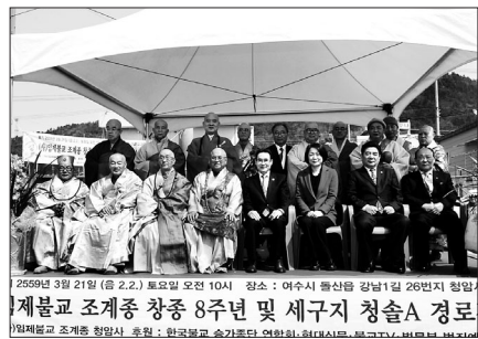
2007년 창종 8주년 기념대법회 모습. 왼쪽: 1991년 창종 10주년 기념대법회 모습. 오른쪽: 조계종 창종 8주년 기념대법회 모습.

지암 스님은 이어 법계고시 중서 수여와 함께 여명학교 장애청소년 3명, 청암사