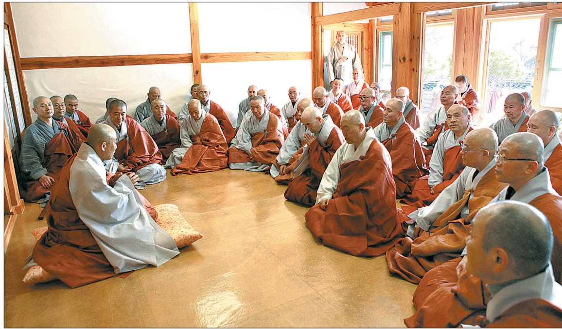
해인총림 해인사 9대 방장에 벽산당 원각 스님이 추대됐다. 스님은 3월 19일 주석처를 해인사 퇴설당으로 옮겼다. 박근혜 대통령은 '방장 스님 작좌식'이라는 메시지를 담은 화분으로 축하했다.