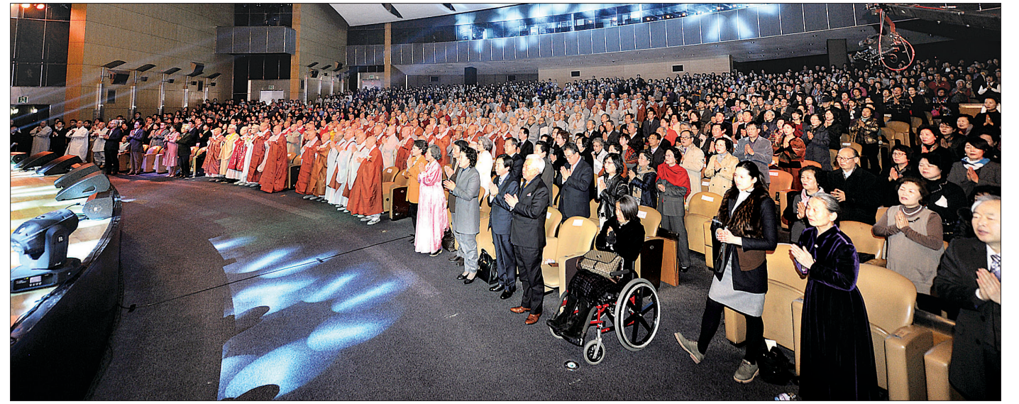
이날 행사에서는 주요 종단 지도자와 인사 등 사부대중 1000명이 참석해 성황을 이루었으며 다채로운 문화공연도 펼쳐졌다.