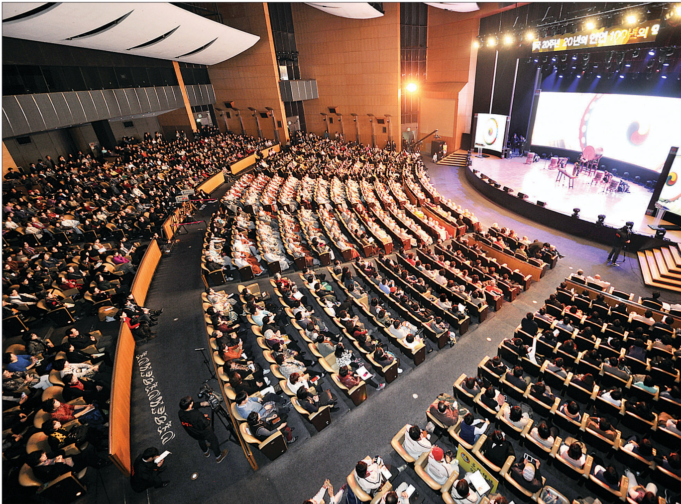
BTN불교TV는 3월 7일 서울 코엑스 오라토리오홀에서 개국 20주년 기념행사를 개최했다. 이날 BTN은 4대전략목표를 발표하고, 새 이니셜을 소개해 새로운 도약을 약속했다. 사진은 기념행사 전경.