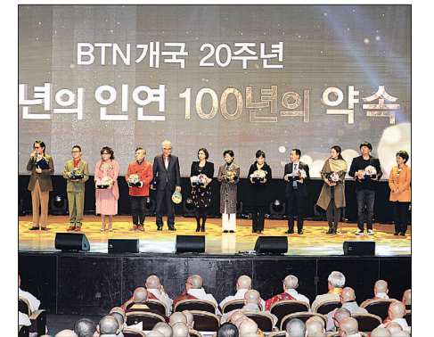
20년간 활동했던 27명의 출연자들에게 감사패를 전달했다.