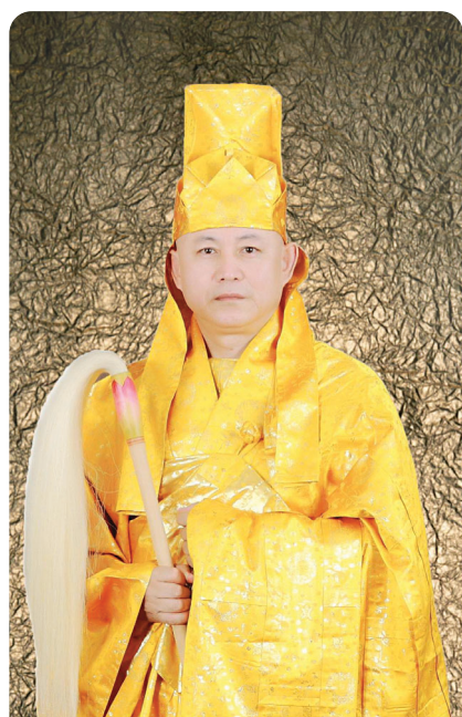
석가여래정법안장 제 77세 정산 석청봉 대종사