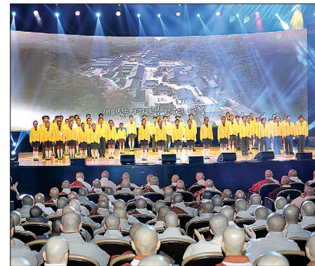
한마음어린이합창단은 'BTN을 빛낸 108명의 인연'을 공연했다.