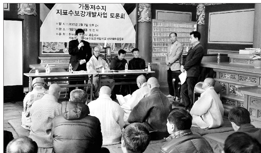
화순 개천사와 3월 7일 대웅전에서 '가동저수지 지표수보강개발사업' 토론회를 개최했다.

하지만 가동저수지 지표수보강개발사업은 문화재보호법 위반 가능성이 높은 것은