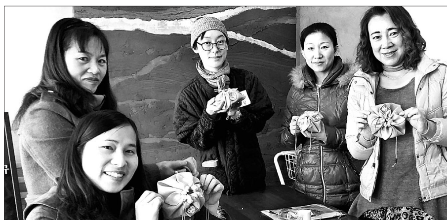
(사)착한벗들이 3월 2일 '결혼이주여성들을 위한 한국전통문화 이해교실'을 열었다.

전북 지역 내 다문화가족을 지원해 오고 있는 (사)착한벗들(대표 회장, 참좋은우리절 주지)이 '결혼이주여성들을 위한 한국전통문화 이해교실'을 열었다.