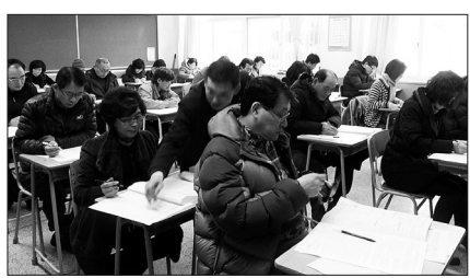
포교원은 2월 28일 서울 동국대 등 8개 고사장에서 '제20기 일반포교사고시'를 실시했다.

조계종 포교원(원장 지원)은 2월 28일 서울 동국대와 강릉여고 등 전국 8개 고사장에서 '제20기 일반포교사고시'를 실시했다.