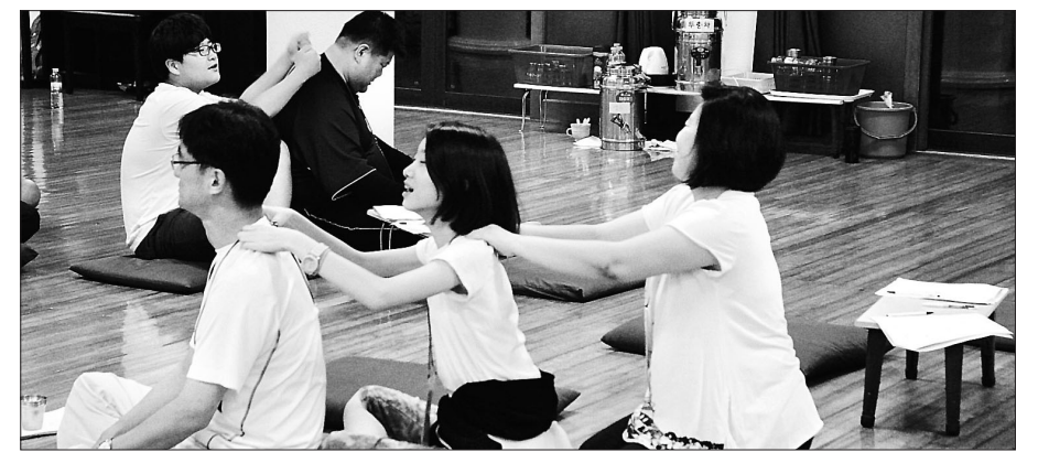
조계종 포교원(원장 지원)은 2월 27일 서울대 인문신앙관 국제회의실에서 열린 '종교계 청소년 인성교육 실무자 워크숍'에서 지난 2014년 실시한 청소년 인성프로그램 '청소년 마음등불' 사례 발표를 했다. 이날 워크숍에서는 한국명상심리상담교육원이 진행한 '명상과 함께 하는 감정조절 프로그램'이 소개됐다.

교계 청소년 인성교육 주요 프로그램에는 불교 '참 나를 찾아가는 여행', 개신교 '생명의 전화 자살예방 활동', 천주교 '청소년 포레 공동체 운영', 유교 '부자 캠프, 사제 캠프', 원불교 '청소년 마음공부 심심플