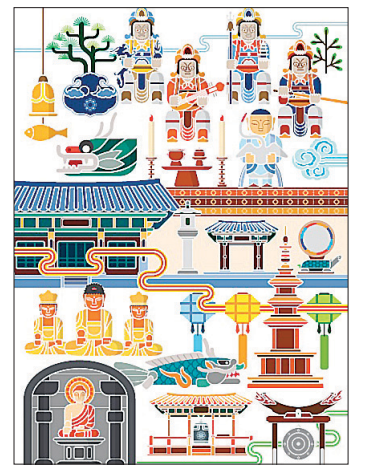
한국불교문화사업단이 개발한 전통 문화콘텐츠 개발 디자인.

사물·사천왕·전각 등 불교문화재가 현대적 디자인을 입고 대중에 선보인다. 한국불교문화사업단(단장 진화)은 3월 4일 열린 기자브리핑에서 2차 문화콘텐츠 개발 시안을 공개했다. 이번 디자인 개발 사업은 전통문화콘텐츠 활용과 템플스테이 패밀리브랜드 ‘아생여당’ 캐릭터 등 두 부분으로 나뉘어 진행됐다. 이를 통해 △사천왕, 사물, 탑 등 불교문화콘텐츠를 활용한 디자인·패턴 개발 70종 △사찰의 건축물 등 불교문화콘텐츠를 활용한 인포그래픽 개발 147종 △아아, 생생, 여여, 당당을 컨셉으로 한 캐릭터 응용동작 개발 83종이 새롭게 개발됐다. 한국디자인진흥원이 개발을 맡은 전통문화콘텐츠 활용 부분은 사물, 사천왕, 탑 등 불교문화콘텐츠를 중심으로 진행됐다. 한국디자인진흥원은 현장실사를 통해 디자인 모사도를 작성한 뒤 패턴을 추출해 디자인을 만들어냈다. 아아, 생생, 여여, 당당 템플스테이 캐릭터는 시놉시스와 성격이 추가됐다. 83종의 다양한 응용동작들을 통해 캐릭터의 감정과 상태를 표현할 수 있게 됐으며 △프로그램 △앱블럼 △이모티콘 등에 활용될 예정이다. 한국불교문화사업단은 “이번 디자인